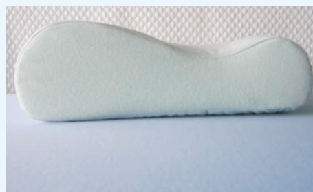
Art. 1525 Nackenpolster mit Velourbezug