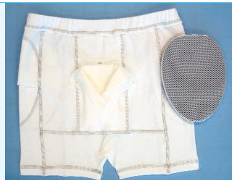
Art. 1014 AHF-Hose – innen mit Penistasche